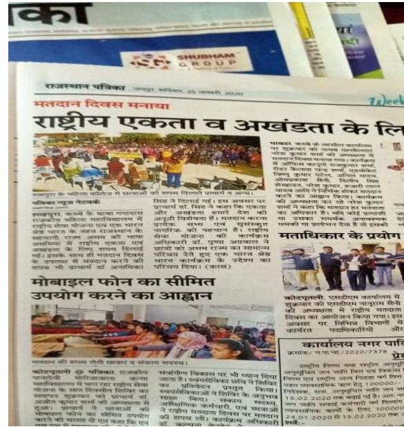
Same for Activity-4